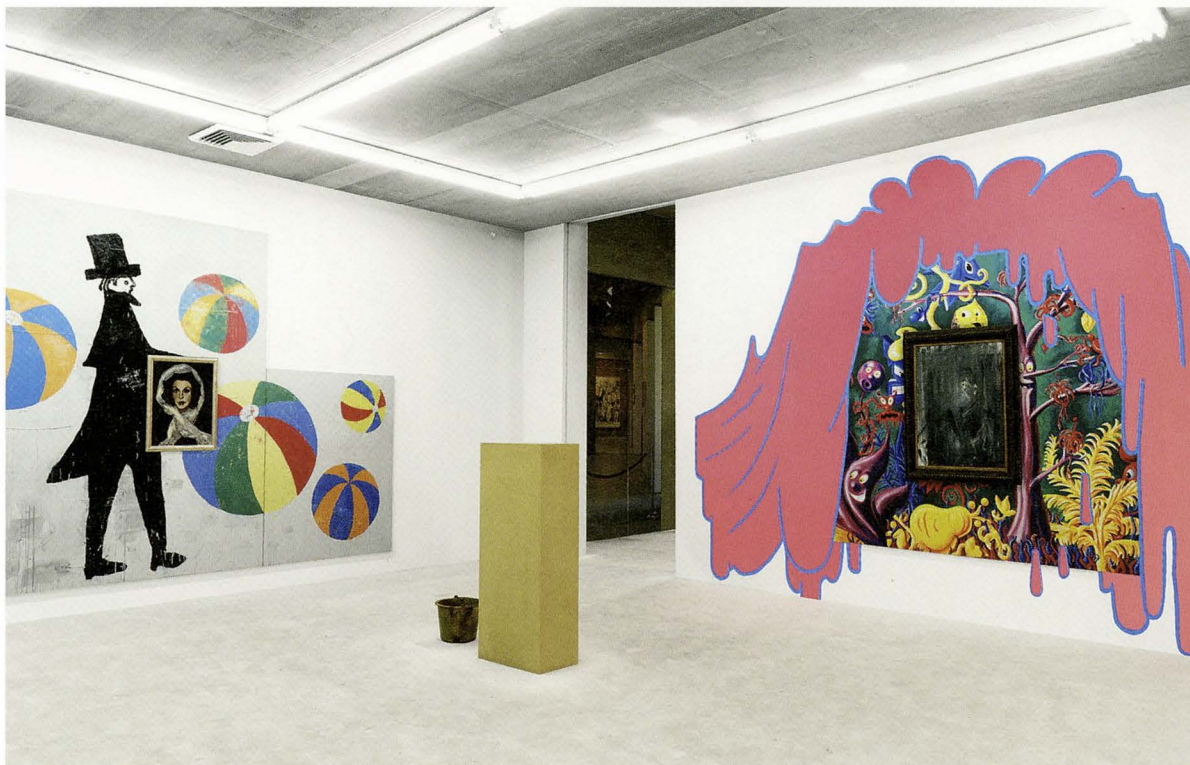
URS FISCHER, ABSTRACT SLAVERY , 2008, wallpaper prints of photographic reproductions of interior spaces, dimensions variable, artworks installed on top of wallpaper: FRANCIS PICABIA, PORTRAIT EINER SCHAUSPIELERIN , SUZANNE ROMAIN, 1943; LILY VAN DER STOKKER, PINK BLUBBER , 2008; FRANCIS BACON, UNTITLED (HEAD) , 1949; sculpture on floor: GEORG HEROLD, EIMER NEBEN SOCKEL , 1987, installation view, "Who's Afraid of Jasper Johns?," Tony Shafrazi Gallery, New York / ABSTRAKTE SKLAVEREI , Tapetendrucke photographisch reproduzierter Innenräume, Masse variabel. (COURTESY OF THE ARTISTS AND TONY SHAFRAZI GALLERY / PHOTO: STEFAN ALTENBURGER)

stehen anstelle von etwas oder jemandem und erinnern an dessen Abwesenheit. Es sind Doubles und Platzhalter für Menschen und Dinge, die nicht mehr da sind. Die von Fischer bevorzugten Verfahren, darunter scheint der Abguss eine besonders wichtige Rolle zu spielen, rufen auch gewisse Tendenzen des Abformens der menschlichen Gestalt in Erinnerung, die sich parallel zur Bildhauerei entwickelten. Eine solche ist natürlich die Totenmaske, Wachs- oder Gipsabgüsse, die gemacht wurden, um Gesichtszüge und -aus-