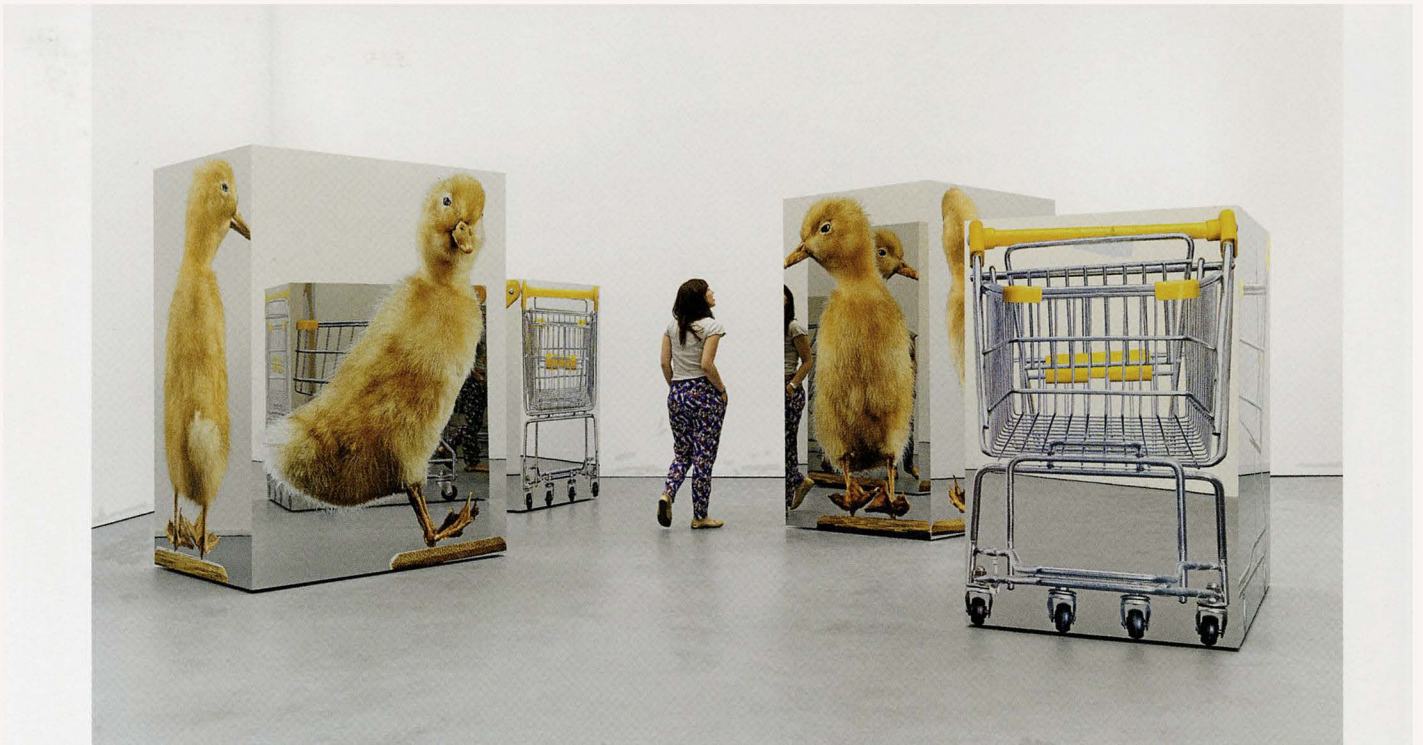
URS FISCHER, FRITZ LANG / SHORTY, 2010, silkscreen print on mirror-polished stainless-steel sheets, polyurethane foam sheets, two-component polyurethane adhesive, stainless-steel beams, aluminum L-sections, screws; in four parts, Shopping cart, each: 64 3 / 4 x 40 1 / 2 x 57 1 / 2 " , Ducky, each: 82 5 / 8 x 57 1 / 2 x 43 1 / 4 " / Siebdruck auf spiegelpolierten Edelstahlplatten, Polyurethan-Schaum-Platten, Zwei-Komponenten-Polyurethan-Klebstoff, Edelstahl-Träger, Aluminium-L-Profile, Schrauben; in vier Teilen, Einkaufswagen, je 164,5 x 103 x 146 cm, Entchen, je: 210 x 146 x 110 cm.