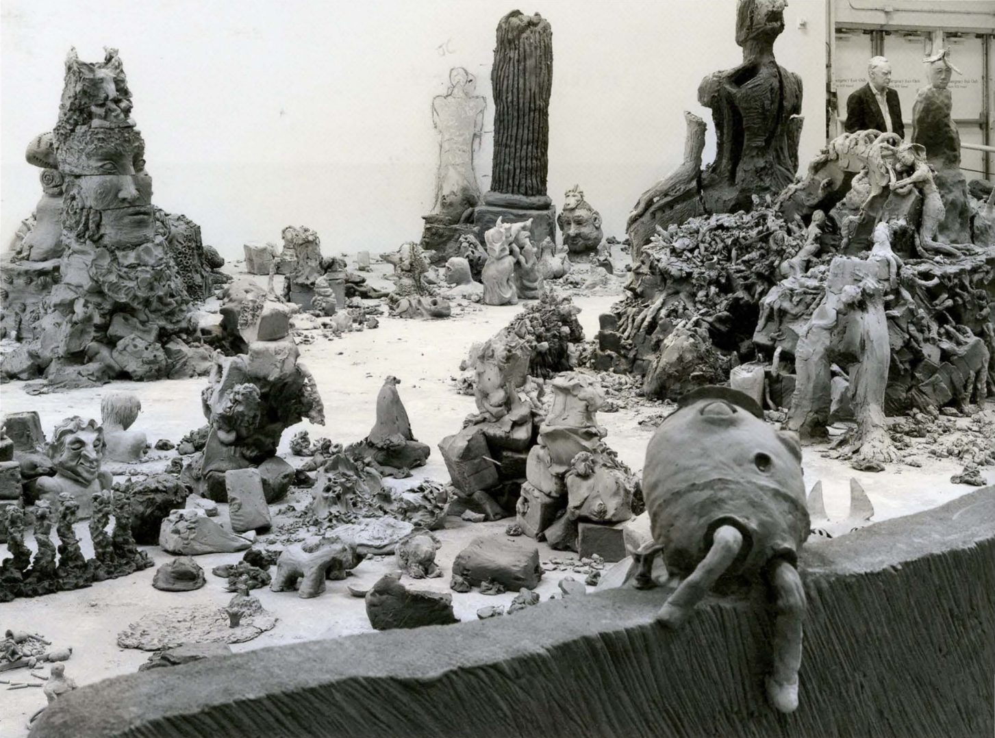
URS FISCHER and VARIOUS ARTISTS, YES, 2011–ongoing, unfired clay sculptures modeled on-site by multiple authors, dimensions variable, installation view, "Urs Fischer," The Geffen Contemporary, The Museum of Contemporary Art, Los Angeles, 2013 / JA, ungebrannte Tonskulpturen vor Ort von verschiedenen Künstlern modelliert, Masse variabel, Installationsansicht.

das eigentliche Zentrum des Ateliers zu sein. Nicht minder wichtig sind die zwischen den Hightechgeräten – und punkto Grösse und Produktionstempo industriell anmutenden Apparaturen – eingerichteten Spielzonen für Kinder; sie werden auch heute von Fischers Tochter und deren Freundinnen und Freunden genutzt. Dies scheint mir ein grundsätzliches Merkmal zu sein, das Fischers häufig gigantische Werke, seine überschäumende