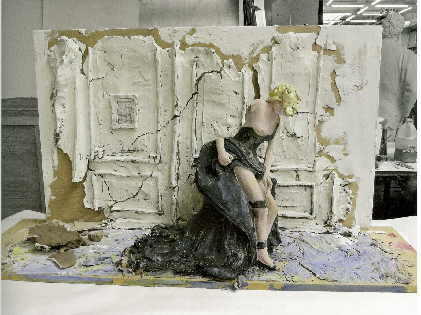
(Work in progress)