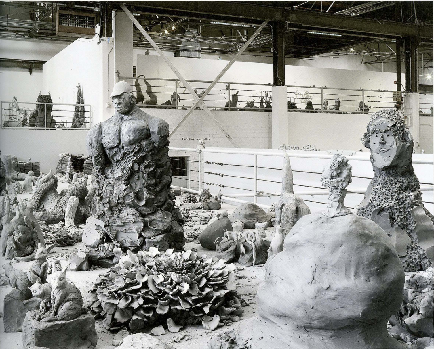
URS FISCHER and VARIOUS ARTISTS, YES, 2011–ongoing, unfired clay sculptures modeled on-site by multiple authors, dimensions variable, installation view, "Urs Fischer," The Geffen Contemporary, The Museum of Contemporary Art, Los Angeles, 2013 / JA, ungebrannte Tonskulpturen vor Ort von verschiedenen Künstlern modelliert, Masse variabel, Installationsansicht.