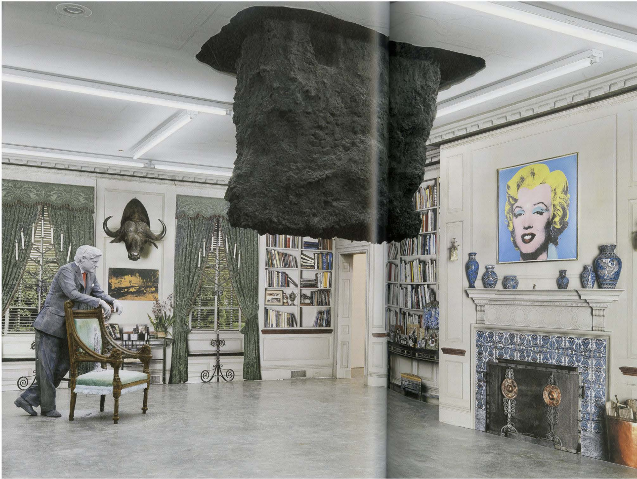
URS FISCHER, ABSTRACT SLAVERY, 2008, wallpaper: prints of photographic reproductions of interior spaces, dimensions variable; UNTITLED (HOLE), 2007, cast aluminum, 212 1/2 x 133 1/8 x 106 1/4"; UNTITLED (STANDING), 2010, paraffin wax mixture, pigment, steel, wicks, 77 x 31 x 52". "Oscar the Grouch," The Brant Foundation Art Study Center, Greenwich, Connecticut, 2010-2011, installation view / ABSTRAKTE SKLAVEREI, Tapetendrucke photographisch reproduzierter Innenräume, Masse variabel; OHNE TITEL (LOCH), Aluminiumguss, 540 x 340 x 270 cm; OHNE TITEL (STEHEND), Paraffin-Wax-Mischung, Pigment, Stahl, Dochte, 195,6 x 78,7 x 132,1 cm. (COURTESY OF THE ARTIST AND THE BRANT FOUNDATION ART STUDY CENTER /)