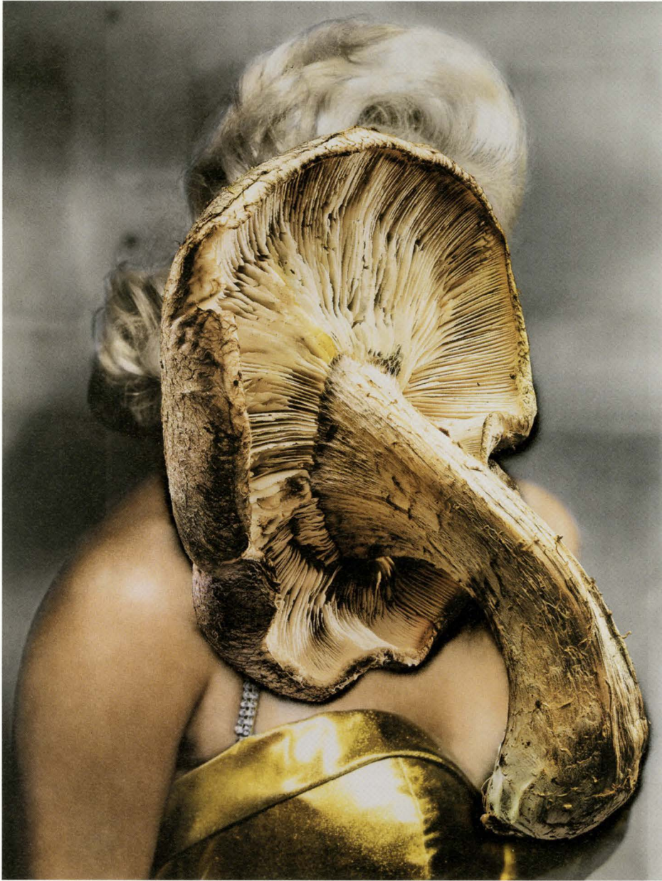
URS FISCHER, PROBLEM PAINTING , 2012, milled aluminum panel, aluminum honeycomb, two-component polyurethane adhesive, wood, screws, acrylic primer, gesso, acrylic ink, spray enamel, acrylic silkscreen medium, acrylic paint, 141 3 / 4 x 106 3 / 8 x 1" / PROBLEM GEMÄLDE , gewalztes Aluminiumpaneel, Aluminium-Wabenplatte, Zwei-Komponenten-Polyurethane-Klebstoff, Holz, Schrauben, Acrylgrundierung, Kreidegrundierung, Acryltinte, Spraylack, Acrylsiebdruck, Acrylfarbe, 360 x 270 x 2,5 cm.