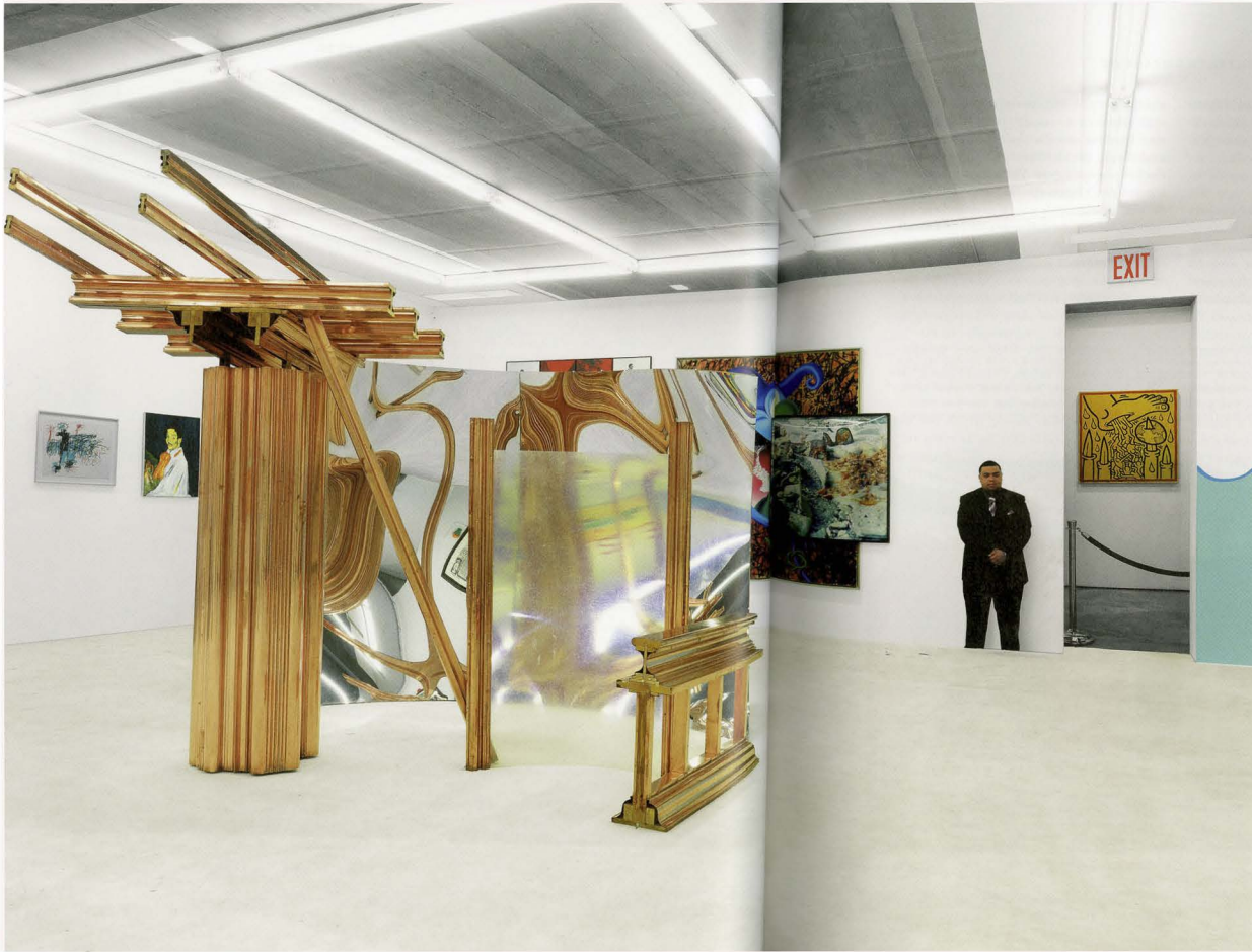
URS FISCHER, ABSTRACT SLAVERY, 2008, wallpaper prints of photographic reproductions of interior spaces, dimensions variable, artworks installed on top of wallpaper: MIKE BIDOLO, NOT PICASSO (SELF-PORTRAIT); YO, PICASSO, 1901, 1986; CINDY SHERMAN, UNTITLED #175, 1987; Sculpture on floor: ROBERT MORRIS, UNTITLED, 1978, installation view, "Who's Afraid of Jasper Johns?," Tony Shafrazi Gallery, New York / ABSTRAKTE SKLAVEREI, Tapetendrucke photographisch reproduzierter Innendäume, Masse variabel. (COURTESY OF THE ARTISTS AND TONY SHAFRAZI GALLERY / PHOTO: STEFAN ALTENBURGER)