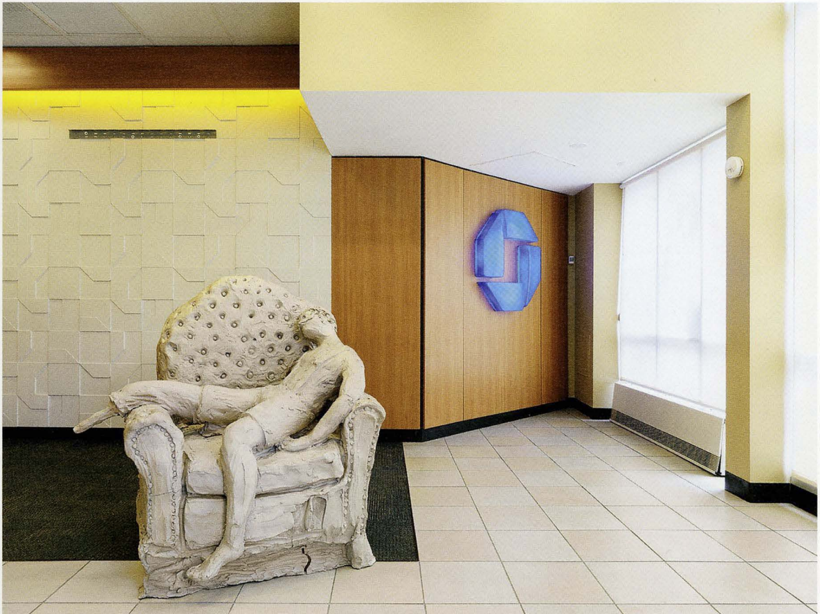
URS FISCHER, BOY IN CHAIR , 2014, cast bronze, 48 1/2 x 37 x 38", installation view, "mermaid / pig / bro w/ hat," Gagosian Gallery at 104 Delancey Street, New York / JUNGE AUF STUHL , Bronzeguss, 123,2 x 94 x 96,5 cm.

aus anfechtbare Weise vermarkteten und zu Geld machten, um ihre eigene «Marke» zu prägen, scheint Fischer sein ruheloses Arbeitstempo und seinen Ideenfluss in ein allumfassendes Projekt münden zu lassen, das jede Einteilung in Gattungen und medien-spezifische oder persönliche Stile unterläuft. Zu bestimmen, wie genau «ein Urs Fischer» aussehen sollte, ist nahezu ein Ding der Unmöglichkeit, einmal abgesehen von einigen seiner bekanntesten Serien. Und selbst wäh-