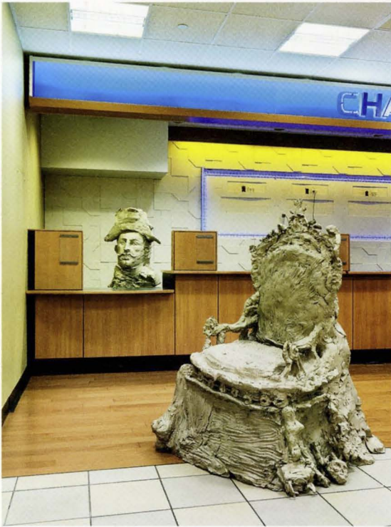
URS FISCHER, NAPOLEON , 2014, cast bronze, 71 x 42 x 48"; LOUIS XIV, 2014, cast bronze, 60 x 43 1/2 x 48 1/2", installation view, "mermaid / pig / bro w/ hat," Gagosian Gallery at 104 Delancey Street, New York / NAPOLEON , Bronzeguss, 180,3 x 106,7 x 121,9 cm; LOUIS XIV, Bronzeguss, 152,4 x 110,5 x 123,2 cm.

rend ich in seinem Atelier herumgehe, erinnert die Anzahl der in Arbeit befindlichen Werke und die verschiedenen Medien und Formen, in denen sie alle gleichzeitig daherkommen, eher an eine Gruppenausstellung als an das Werk eines bestimmten Künstlers zu einem bestimmten Zeitpunkt.