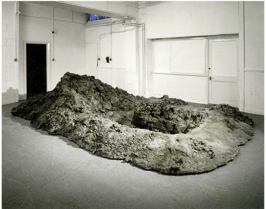
URS FISCHER, UNTITLED (HOLE) , 2007, cast aluminum, 212 1/2 x 133 7/8 x 106 1/4", installation view, "Uh...", Sadie Coles HQ, London / OHNE TITEL (LOCH) , Aluminiumguss, 540 x 340 x 270 cm.

In their almost sculptural opposition between the "image" behind and the "object" in front, the "PROBLEM PAINTINGS" show Fischer continuing to think through these same issues. Photography is here employed to tackle one of the most fundamental challenges of figurative painting: how to depict volumetric mass and space on a flat plane. Walking around with Fischer in the well-orchestrated chaos of his studio, it strikes me that despite appearances to the contrary, he is less a maker of objects than a producer of images, whether in two or three dimensions. Or perhaps, better yet, we might resurrect another term even more antiquated than studio, and say that what he creates are tableaux.