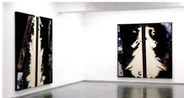
石井孝之 (Taka Ishii) 画廊内的漂白水纺织物绘画展览“BC RIPS”。 [Installation view, BC RIPS, Taka Ishii Gallery, Tokyo.]