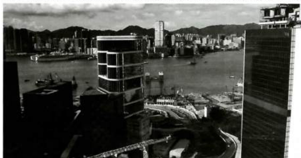
“奕居”窗外无与伦比的香港景致。 [View from hotel room in Hong Kong.]

张晓刚和李松松工作室拜访的经历。在对话的最后，我们送给了尤伦斯中心馆长田霏宇一顶印有洛杉矶字样的棒球帽，他当即戴上帽子，现场的观众都为他顶着帽子的样子雀跃。这个举动像是个仪式，将洛杉矶和北京两地联系在一起，展览随即开幕。