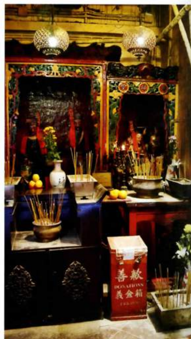
“燃烧的供品，象征了信徒们伪善的欲望”， 香港文武庙香火长明的焚烧炉。 [Interior view of Man Mo Temple, Hong Kong. ]