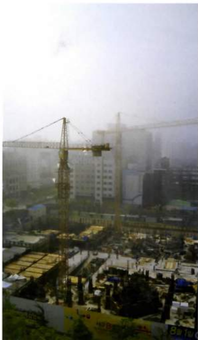
清晨朦胧的光州，开启了斯达林·鲁比亚亚洲行的第一天。 [View from hotel room in Gwangju.]