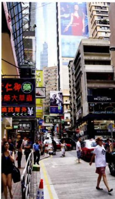
斯达林·鲁比亚相机中的人山人海的香港。 [Hong Kong Street Scene.]