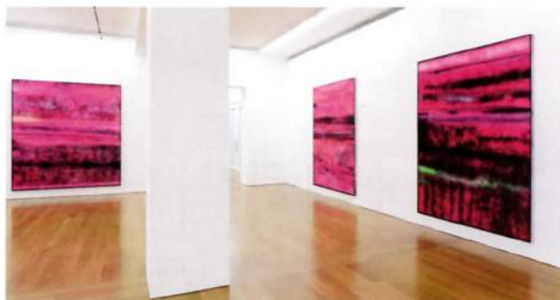
以粉红色为中心主题的“VIVIDS”展览。 [Installation View, VIVIDS, Gagosian Hong Kong.]