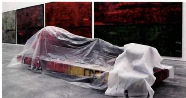
“洛杉矶计划”展中一件尚未揭开面纱的神秘艺术品。 [Installation in progress, The Los Angeles Project, Ullens Center for Contemporary Art, Beijing.]