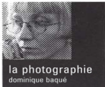
la photographie dominique baqué