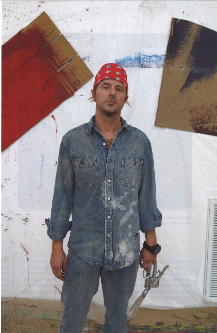
Sterling Ruby dans son atelier.

“J’ai commencé à peindre en m’inspirant des graffitis et des tags réalisés par les gangs à proximité de mon domicile et de mon atelier.”